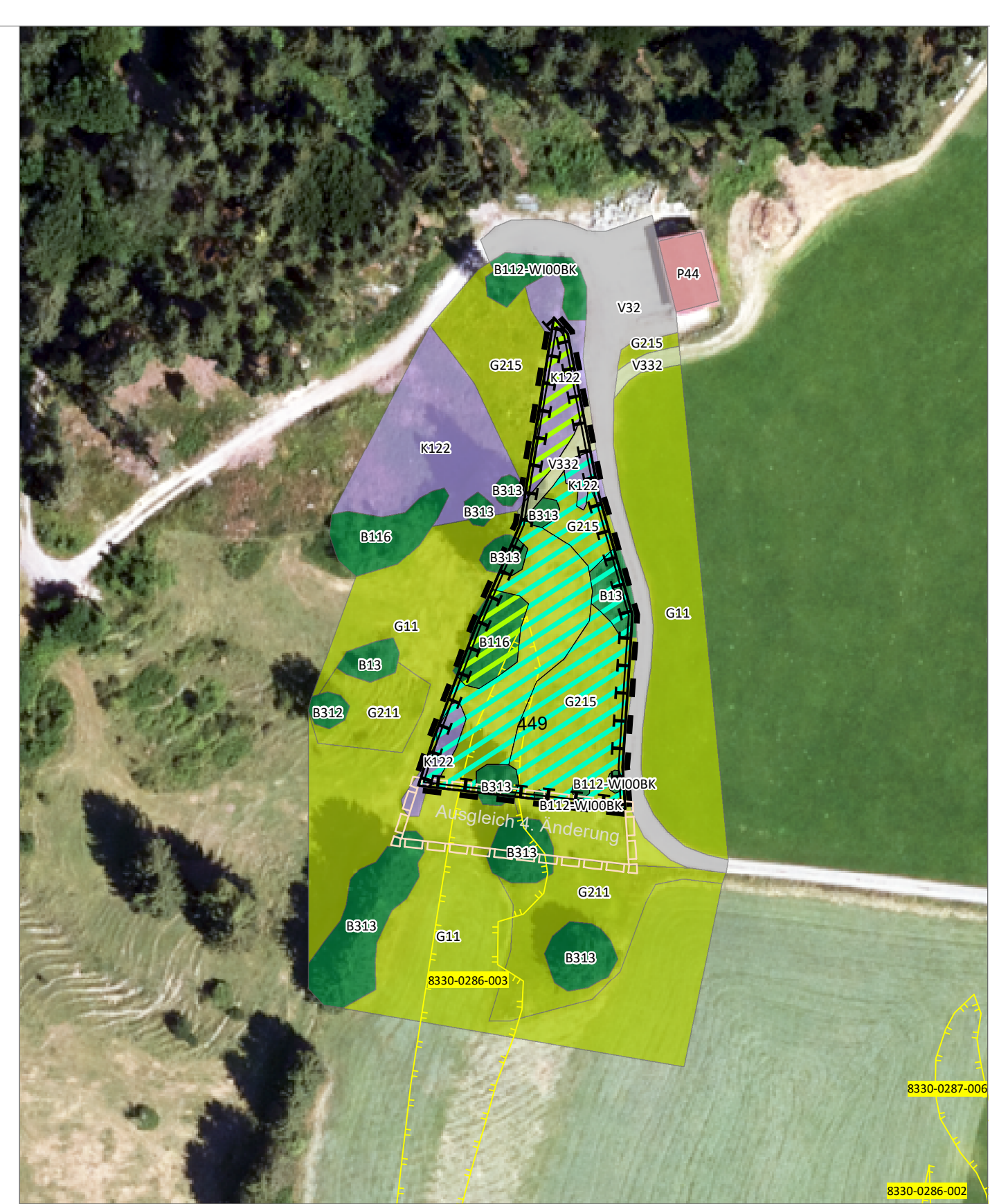
Bestand und Ermittlung Ausgleichsumfang Kompensationsfläche 3