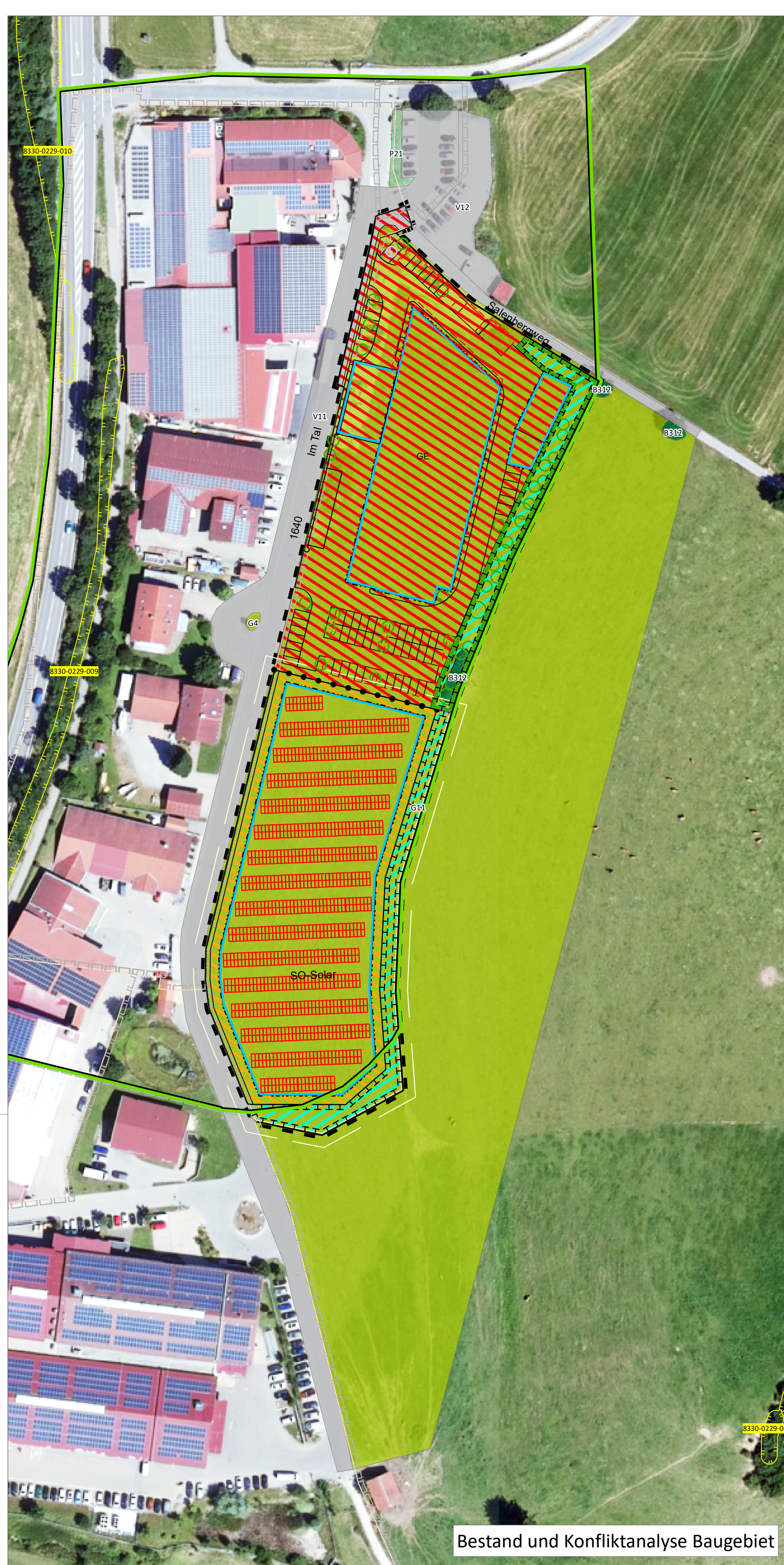
Bestand und Konfliktanalyse Baugebiet